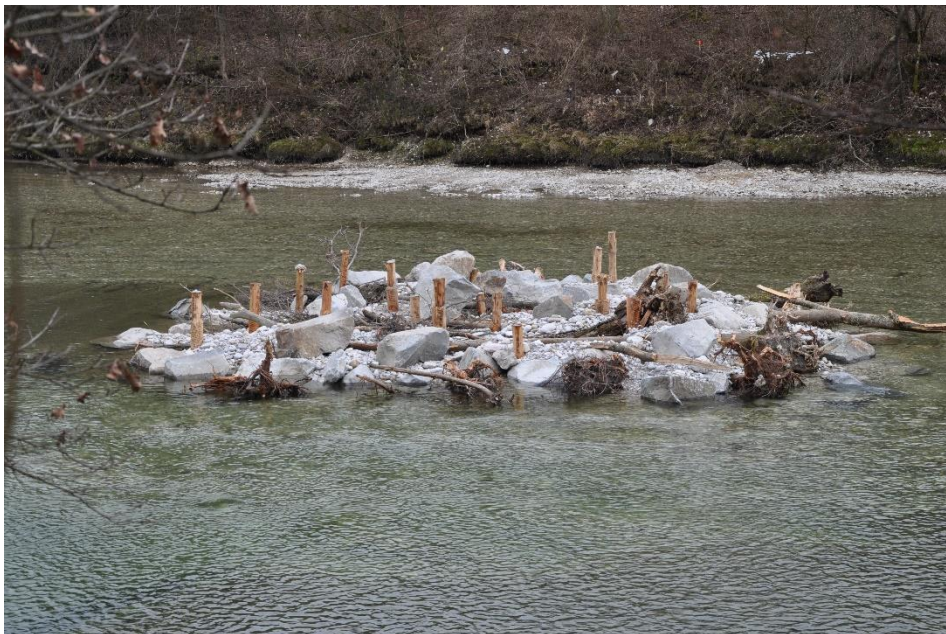
Abb. 2 Ein sog. Chevron in einer Restwasserstrecke der Traun

Werden Nebenarmsysteme oder Aufweitungen in der Restwasserstrecke angelegt, so muss das hierbei gewonnene Kiesmaterial unbedingt in das Flussbett eingebracht werden. Um den unerwünscht raschen Abtransport dieser Geschiebezugaben zu verhindern können Strukturen eingebracht werden, die eine gewisse Schutzfunktion bieten. In einer Restwasserstrecke der Traun wurden zu diesem Zweck sog. „Chevrons“ - das sind sehr groß dimensionierte strukturgebende Gewässer-Einbauten aus Baumstämmen, kombiniert mit großen Wasserbausteinen und mittels geeigneter Materialien, etwa Eisenbahnschienen, in der Sohle verankert – eingebaut (Abb. 2). Beim Monitoring dieser Einbauten zeigte sich, dass sie – obwohl in diesem Fall etwas zu gering dimensioniert - hinsichtlich Individuendichten und Artenzahl die am dichtesten besiedelten Habitate in der ganzen Restwasserstrecke darstellten (CSAR et al. 2017). Dies nicht zuletzt deswegen, weil sich in ihrem Strömungsschatten zumindest lokale Schotterzungen ausbilden und Bestand haben.