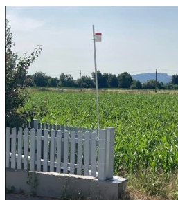
Abb. Messergebnisse mit Passivsammler am 2. Standort