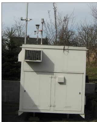
Abb. Luftmesscontainer Land OÖ

Der Container wurde Mitte November 2022 bei einem Anrainer des Ziegelwerks, etwa 400 m in Hauptwindrichtung von den Abluftkaminen entfernt, aufgestellt und es wurde vereinbart, die Messungen bis Mitte März 2023 zu betreiben (der Messcontainer war ab diesem Zeitpunkt schon wieder anderweitig reserviert). Die nächste Verhandlungsrunde fand am 16. Jänner 2023 statt und es wurden bereits erste Ergebnisse präsentiert. Grenzwerte bei den klassischen Luftschadstoffen waren bis zu diesem Zeitpunkt nicht überschritten, allerdings deutlich erhöhte Werte bei Schwefeldioxid (SO 2 , die höchsten in diesem Zeitraum in Oberösterreich gemessenen!) festzustellen.