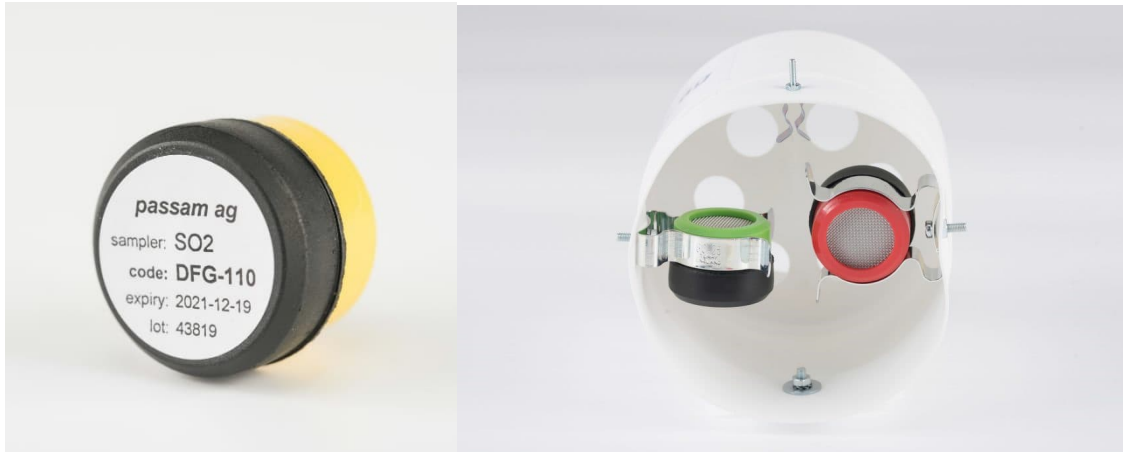
Abbildungen: Prüfvorrichtung, Schutzvorrichtung mit eingehängtem Probenehmer

Für die Untersuchungen der Oö. Umweltschutz wurden Passivsammler der Schweizer Firma Passam AG verwendet. Die Laboruntersuchungen wurden ebenfalls in der Schweiz durchgeführt. Gemessen wurden Langzeitmittelwerte von jeweils etwa einem Monat. Der passive Probenehmer basiert auf dem Prinzip der Diffusion von SO 2 -Molekülen auf das Absorbens aus Kaliumkarbonat und Glycerin. Die Quantifizierung erfolgt durch Ionenchromatographie. Die Probenehmer bestehen aus einem Polypropylengehäuse mit einer Öffnung von 20 mm Durchmesser.