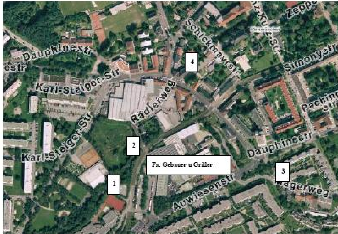
Expositionsstandorte der Weidelgraskulturen im Umkreis der Fa. Gebauer & Griller